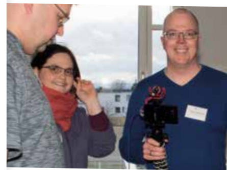
In drei Schritten zum eigenen Videobeitrag: Drehen, schneiden, exportieren.