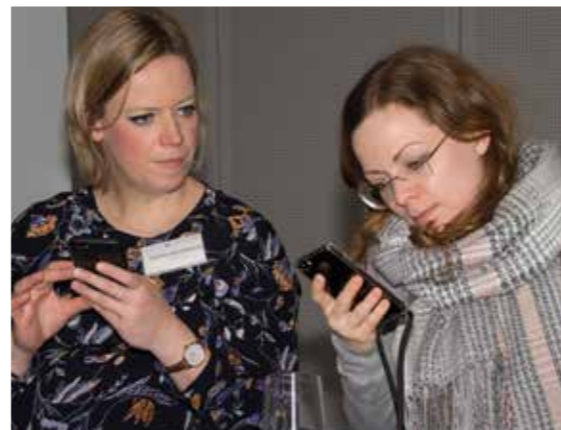
Smartphone in der Hand ausdrücklich erwünscht: Im Videocamp erlernten die Teilnehmer die Grundlagen der Produktion und Postproduktion von Videos.